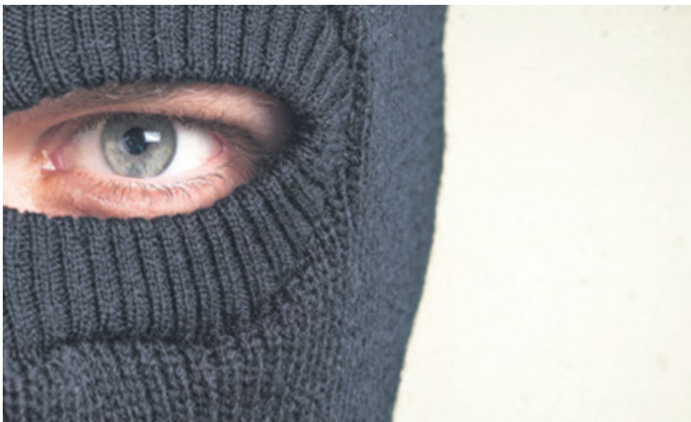
Nezaposlenost i kriminal više povezani kod teških krađa

Ekonomski institut pita se ima li veze stopa nezaposlenosti i učestalost kriminala.