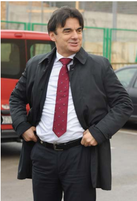
Potpredsjednik Grčić napokon zadovoljan