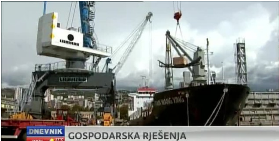
Gospodarska rješenja