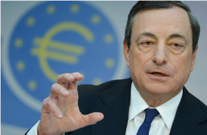
Mario Draghi

Njemački mediji jedva dočekali da najave kraj ere niskih kamata, nama bi to potkopalo šanse za oporavak