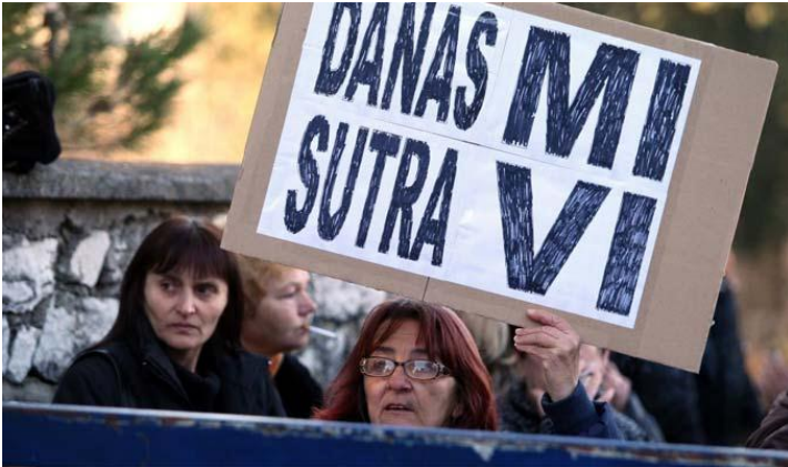
Još se traži prava metodologija...

Pripetavanje između Državnog zavoda za statistiku i Ministarstva rada tko ima točnu evidenciju zaposlenosti rezultirala je osnivanjem radne grupe koja bi uskoro trebala izići s prijedlogom o novom statističkom modelu zaposlenih. Kako neslužbeno doznajemo, razmišlja se o tome da se statistika zaposlenih vodi preko jedinstvenog obrasca poreza, prireza i doprinosa (JOPPD) Porezne uprave.